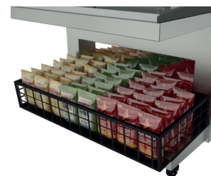
Корзины перекрестных продаж