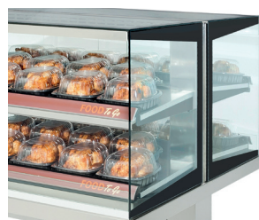
Оптимальная видимость продукта

Большие прозрачные боковые окна и верхняя панель предоставляют возможность полного обзор продукта на 360 градусов. Привлекательный прозрачный дизайн обеспечивает выдающуюся презентацию продукта, которая, несомненно, будет активно стимулировать спонтанные продажи. Для удобства во время уборки, можно открыть боковые окна.