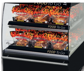
MDS 86-2 self serve

* Weitere Informationen über die 4- und 5-Spieß-Grills siehe separate Datenblätter