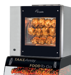
Space Saver TDR5 M