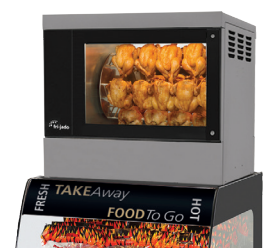
Space Saver TG 4