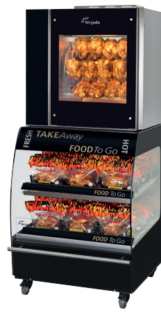
Space Saver TDR5 P

Der Space Saver von Fri-Jado ist ein Paradebeispiel für effektive Raumnutzung. Durch die Kombination eines TDR 5-Grills mit einem MDS 86-2 Self-Serve Grab-and-Go-Merchandiser sparen Sie wertvollen Platz.