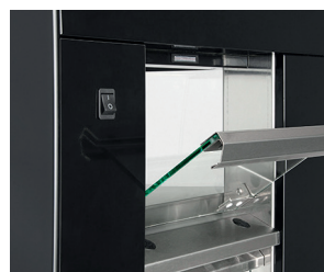
Türen auf Rückseite