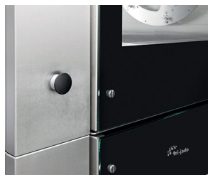
Draaiknop aan de klantzijde