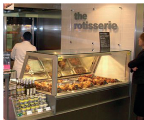
Hot Deli square