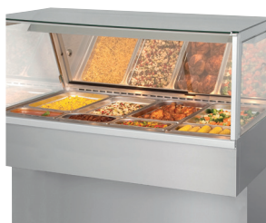
Hot Deli 4 square Full-Serve