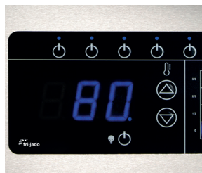
Panel de control Premium