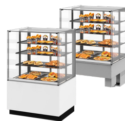
Bodenmodell oder Drop-in