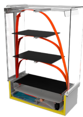
Patentierter Hot Blanket-Techno- logie mit Warmhaltegarantie