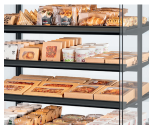
Visibilité ultime du produit - design transparent, étagères minces, aucune distraction.

Pour voir plus d'avantages du MDD, consultez frijado.com