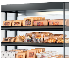
Voedsel (letterlijk) in de spotlights - Ledverlichting boven elk schap.