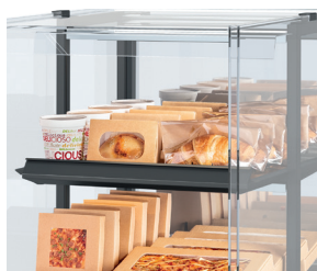
Nahrungsmittel (buchstäblich) im Rampenlicht - LED-Beleuchtung über jedem Fach.