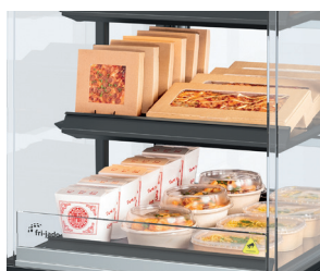
Ultimative Produktsichtbarkeit - transparentes Design, schlanke Regale, keine Ablenkung.

Weitere Vorteile des MDD finden Sie auf frijado.com