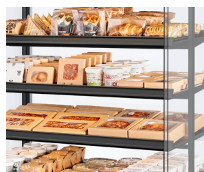
Visibilité ultime du produit - design transparent, étagères minces, aucune distraction.

Pour voir plus d'avantages du MDD, consultez frijado.com