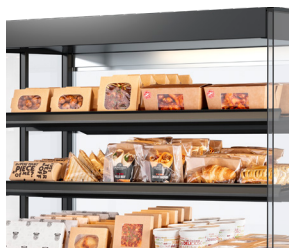
Les aliments sous les projecteurs (littéralement) - Éclairage LED au-dessus de chaque étagère.