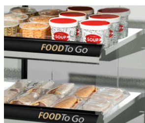
Visibilidad óptima de productos