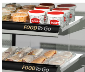
Visibilité optimale du produit