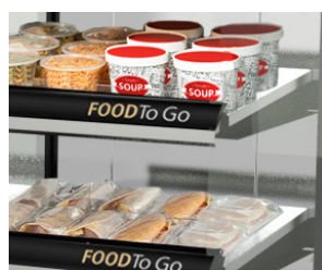
Visibilidad óptima de productos