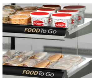
Visibilité optimale du produit