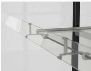
Accesorios - Juego de soportes para regletas portaprecios