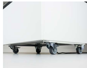
Accesorios - Juego de ruedas