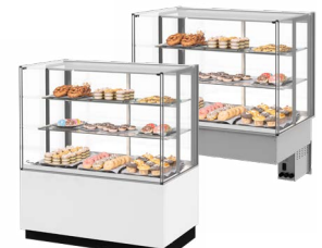
Modelle mit Unterbau oder Einbaumodell