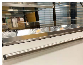
Zubehör - Stoßfänger