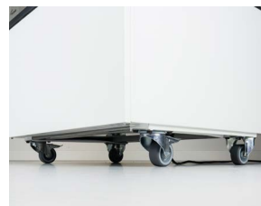
Zubehör - Satz mit Rollen